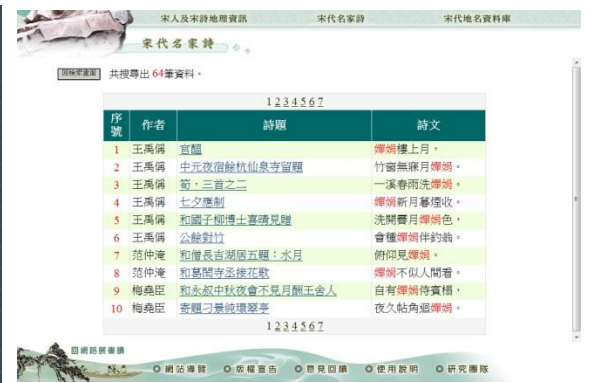
圖 6：功能頁之五：檢索宋詩（嬋娟）