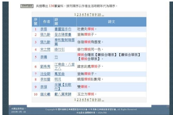
圖 5：功能頁之四：檢索全唐詩（嬋娟）